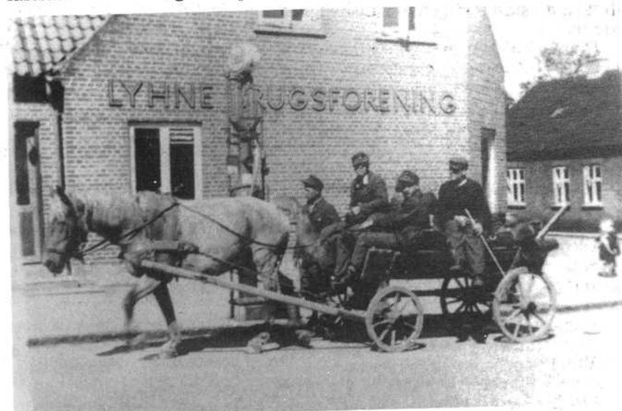
En gruppe af krigens tabere passerer Brugsen på vej hjem

Nu rettes der an til en forsinket jubilæumsfest, men med freden som baggrund vil den sikkert komme til at overgå alle de foregående. Dagen er fastsast til den 20. og 21. september.