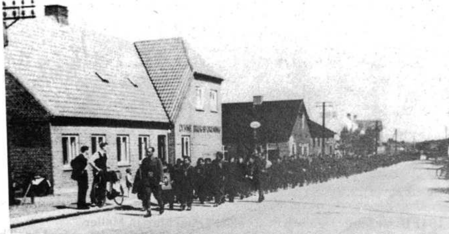
Tyske soldater på hjemmarch gennem Lyne