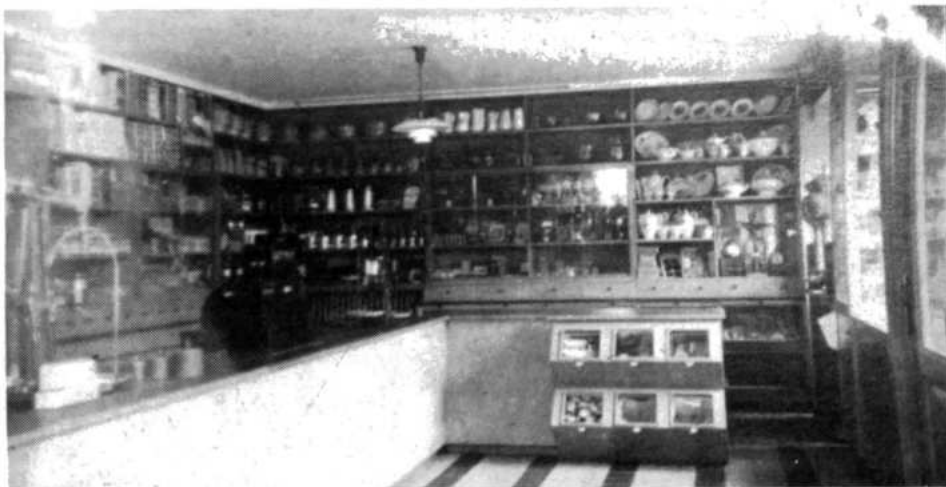
Den gamle butik