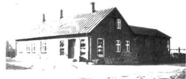
Den gamle Brugs