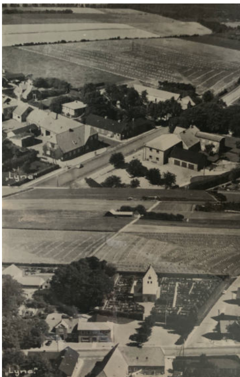
Luftfoto af Lyne

Den 1. april 1958 væltede den gamle kørestald*, og der opføres en bygning med lokale til nye toiletter i Ølgod Sparekasse, rutebilstation, telefonboks og skrædderværksted.