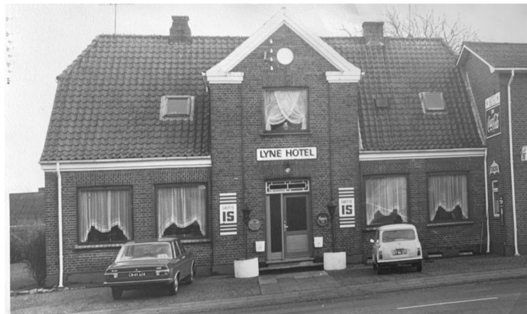
Lyne hotel i 1974

Land & fritid/DLG i Ølgod kopierer kalenderen gratis.