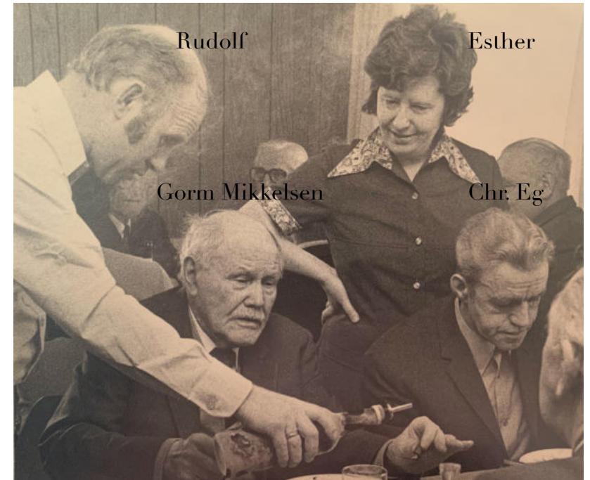
1. april 1976 - 25 års jubilæum

I 1959 udvides hotellet til 11 værelser, 3 badeværelser, rejsesstue og større privatbolig.