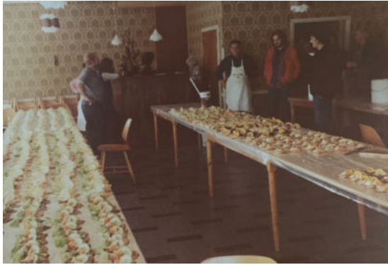
Smørrebrød til hallens åbning