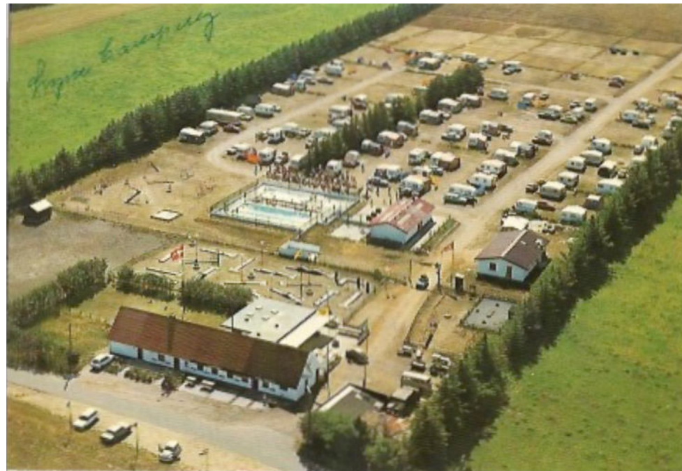
Lyne camping - ejer Knud Hansen. Campingpladsen lukkede i 2011.