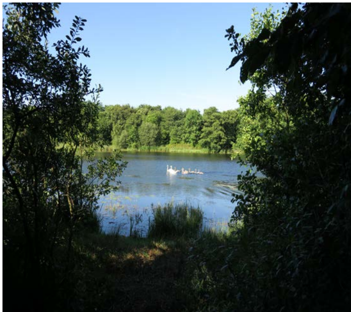
Starbæk Møllensø. Her er det muligt at nyde medbragt mad og drikke.

Vandre- eller cykeltur. Mellem Strellevvej og Knudevej følger du markvejen gennem en mose – her ses om sommeren kærulden med sit vattotlignende uldhår.