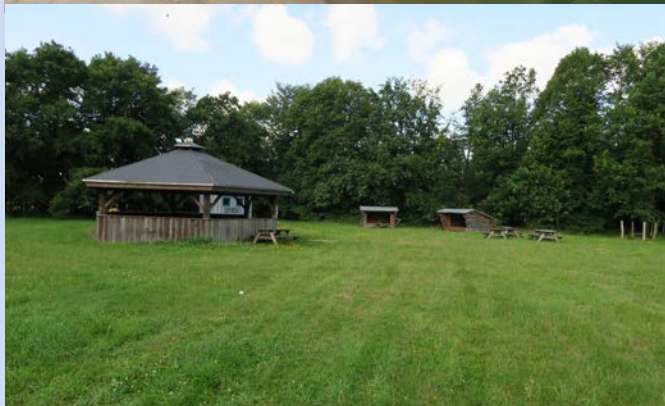
Shelterplads lige nord for Lyne by.